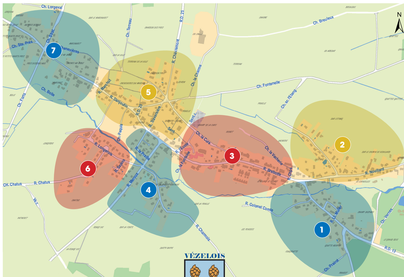
Jean JUSRET 467, rue de chenevières